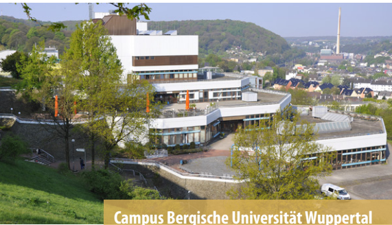
Campus Bergische Universität Wuppertal

Die Bergische Universität Wuppertal ist eine junge, dynamische Hochschule im Herzen Europas. In 102 Studiengängen und acht Fakultäten studieren derzeit 20.141 Studierende.