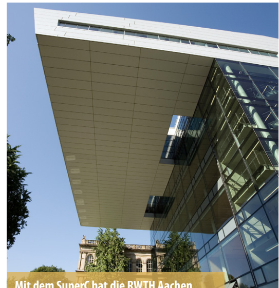
Mit dem SuperC hat die RWTH Aachen auf dem Campus Mitte ein lebendiges Begegnungszentrum im Kernbereich von Stadt und Hochschule geschaffen.