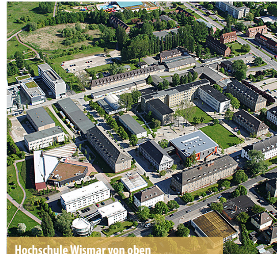
Hochschule Wismar von oben