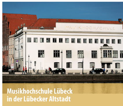
Musikhochschule Lübeck in der Lübecker Altstadt

2010 als gemeinnütziger Verein gegründet, bietet der Alumni-Verein der MHL ehemaligen Studierenden und Mitarbeitern ein neues altes Zuhause. Primäre Vereinsziele sind der kontinuierliche Netzerkaufbau, Austausch