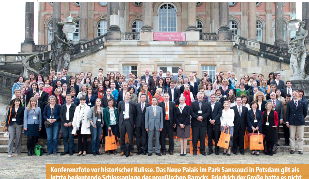
Konferenzfoto vor historischer Kulisse. Das Neue Palais im Park Sanssouci in Potsdam gilt als letzte bedeutende Schlossanlage des preußischen Barocks. Friedrich der Große hatte es nicht als königliche Residenz geplant, sondern als Schloss für Gäste seines Hofes. Zu Gast im Neuen Palais waren auf Einladung der Universität Potsdam auch die Teilnehmer der Konferenz.