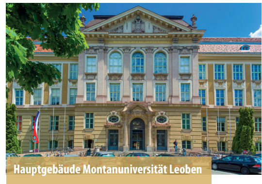
Hauptgebäude Montanuniversität Leoben

Der Alumni Club Montanuniversität wurde am 1. Oktober 2015 im Rahmen der 175-Jahr-Feier der österreichischen Montanuniversität Leoben als Teil des Rektoratsbüros aus der Taufe gehoben und gibt dem Netzwerk zwischen Alumni, Universität und Partnerfirmen seither einen formellen Rahmen. Ziel des Alumni Clubs ist es, über die Zeit der eigentlichen Ausbildung hinaus eine Beziehung zu den Alumni aufrechtzuerhalten. Gerade die Alumni der Montanuniversität verfügen aufgrund der Kleinheit der Universität und der damit einhergehenden Vielzahl an persönlichen Beziehungen, der besonderen fachlichen Ausrichtung der Universität und nicht zuletzt aufgrund der besonderen Campus-Kultur über eine starke Identifikation mit ihrer Alma Mater.